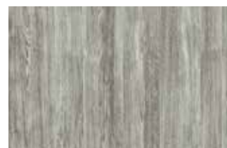
Sheffield Oak concrete, nr koloru 2039L

Trzy nowe, matowe okleiny okienne, ze strukturą prawdziwego drewna, zmienią Twoje okna na lata.