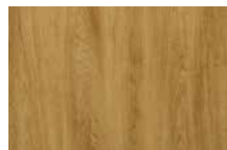
Turner Oak malt, nr koloru 2031L