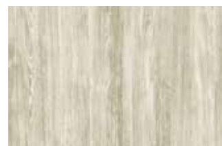
Sheffield Oak alpine, nr koloru 2038L

Zainteresowały cię nowe kolory okien REHAU? Chętnie doradzimy!